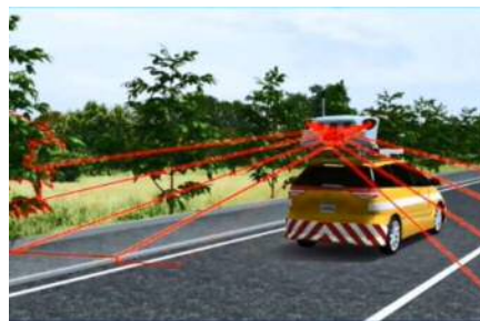
3次元点群データの計測