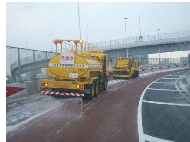
凍結防止剤(塩水)の散布状況

首都東京の社会インフラとしての信頼性を確保するため、大雪時の長時間の車両滞留や通行止めの長期化の回避をはじめ、地震や大雨・大雪等の災害発生時に、過去の経験を踏まえた適切な交通運用、お客様への適切な情報提供・安全な誘導を行い、迅速に対応します。