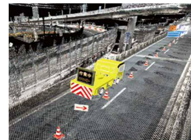
3次元点群データ・規制帯シミュレーションにおける確認状況