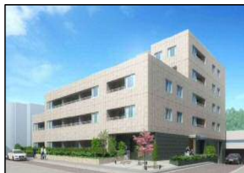
研修所跡地活用後のイメージ