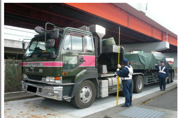
⑥【三郷地区車両取締基地】