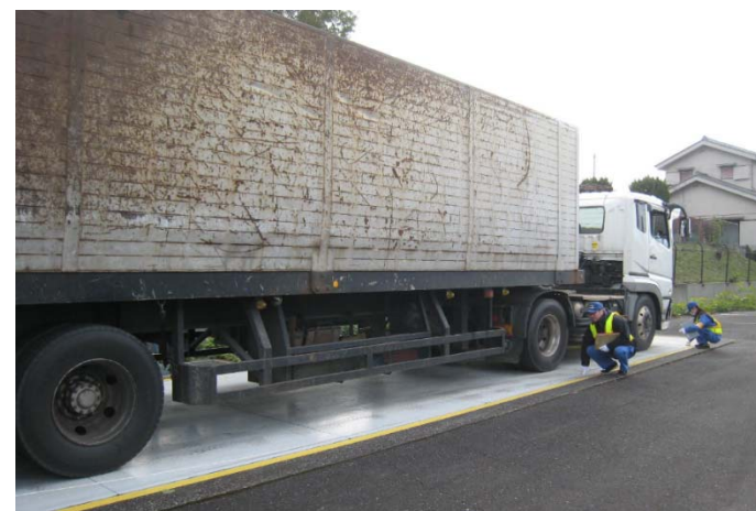
⑤【狭山特殊車両基地】