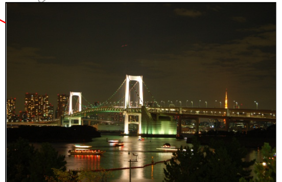
レインボーブリッジ