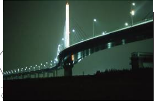
かつしかハープ橋