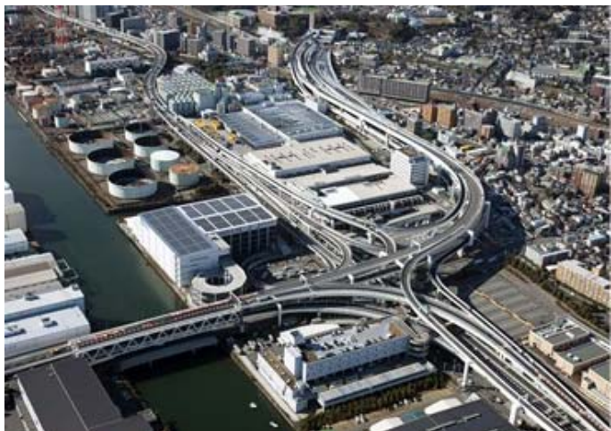
① 生麦ジャンクション