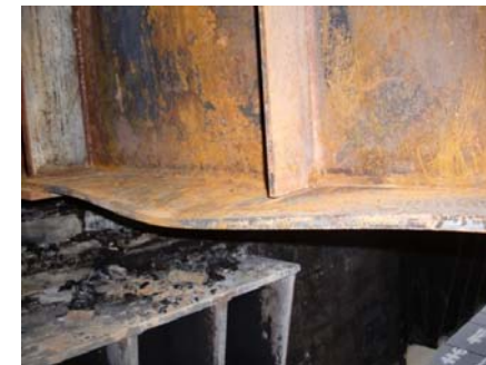
写真-2 主桁の一部変形状況