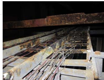
写真-3 附属物（ケーブルラック）焼損状況