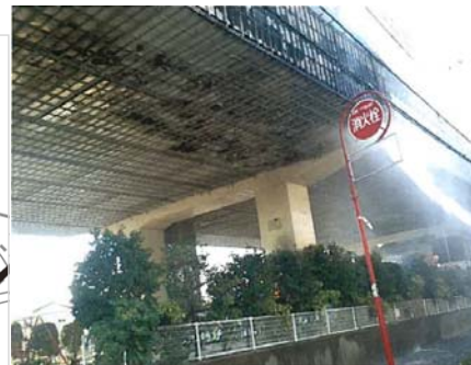
写真-1 消防による放水状況