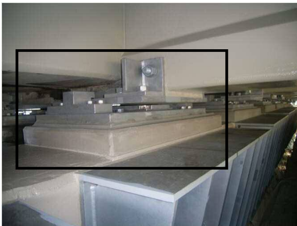
耐震性能が高い支承へ交換