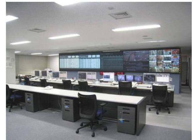
施設管制システムの更新 (東東京管理局)