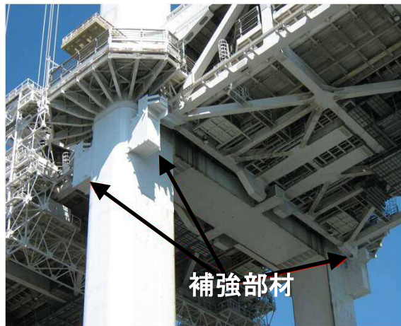
補強部材の設置(レインボーブリッジ)