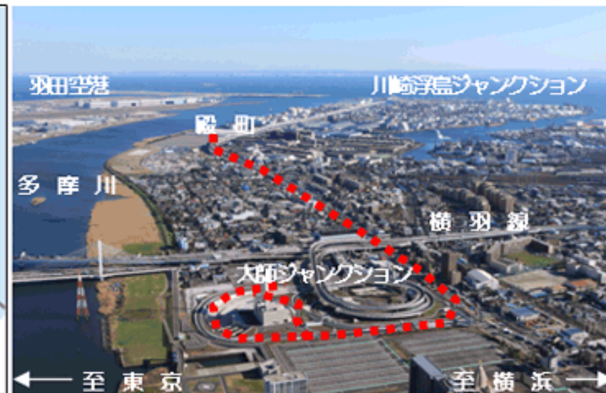
川崎線全景(殿町～大師ジャンクション) (●●● 今回の開通区間)