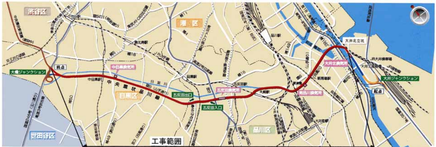
① シールドトンネル 出入口 概略図 (概略図)