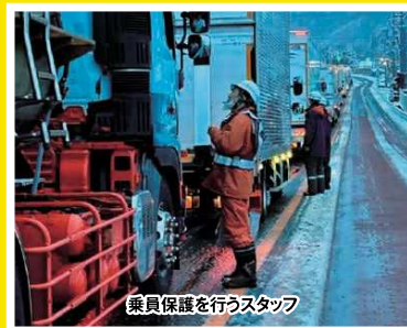
令和7年3月 山梨県内国道20号における 車両滞留の発生状況