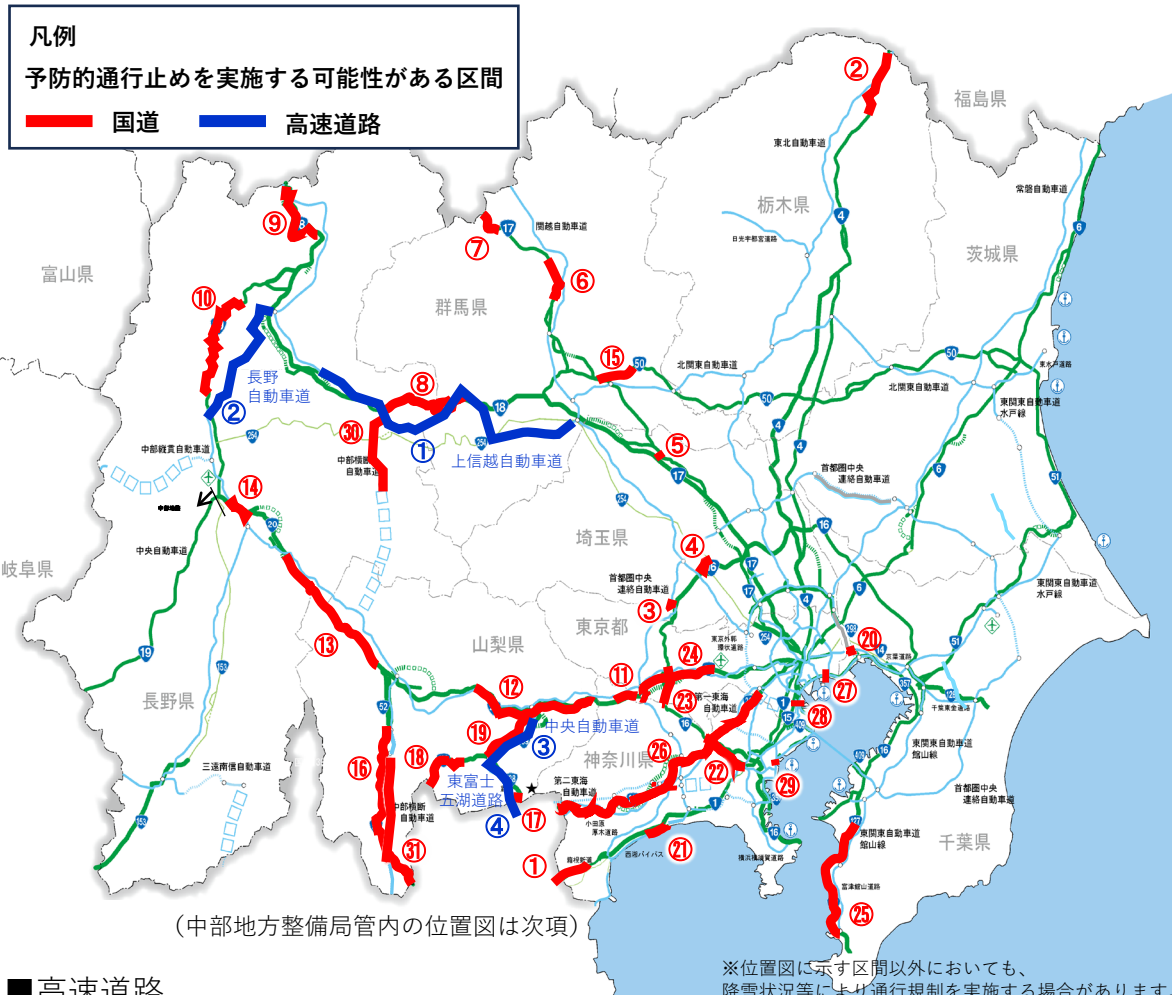
(中部地方整備局管内の位置図は次項)

※位置図に示す区間以外においても、降雪状況等により通行規制を実施する場合があります。