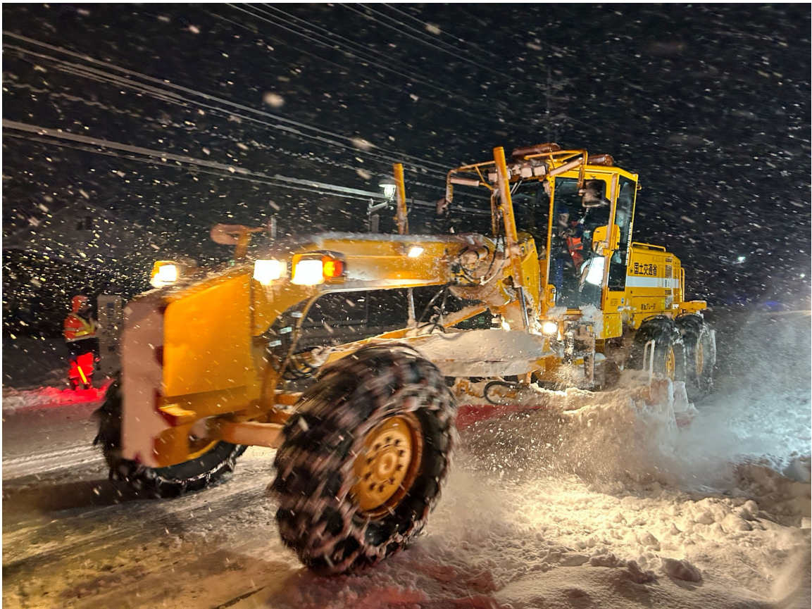
除雪実施状況 (令和5年1月8日 国道18号 長野市)