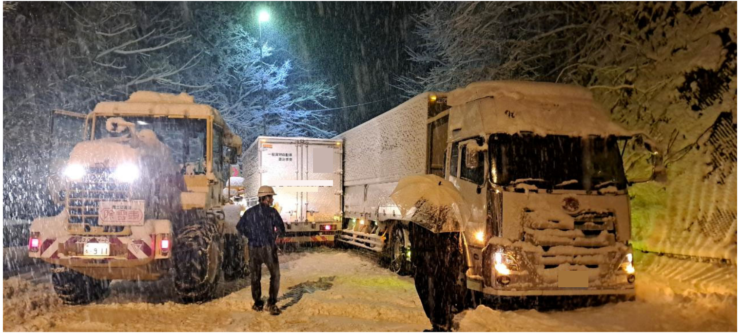
過去の車両滞留の状況 (令和6年2月5日 国道19号 生坂村東広津)