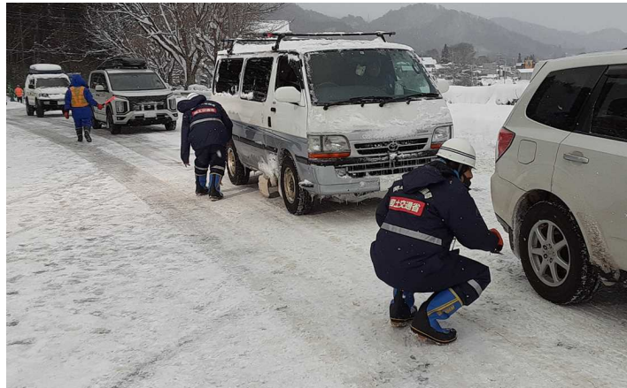
タイヤチェックの状況 (令和4年1月1日 国道17号みなかみ町)