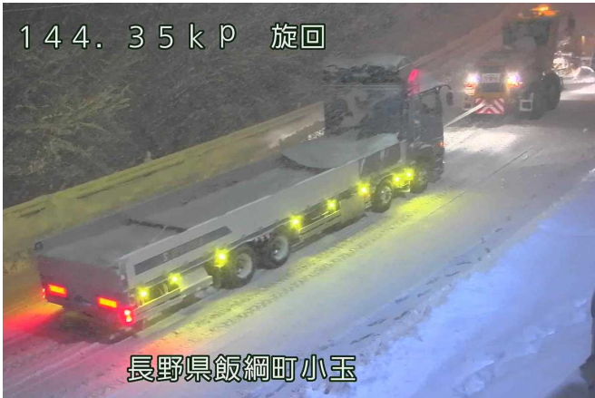
スタック車両の牽引状況 (令和3年12月17日 国道18号飯綱町)