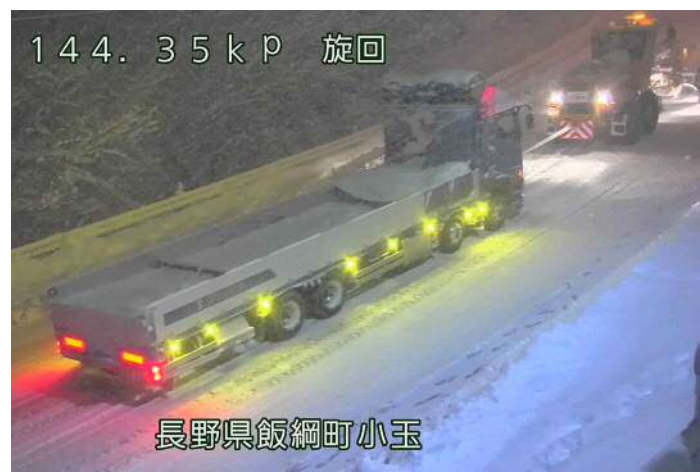
144.35kP 旋回 長野県飯綱町小玉 スタック車両の牽引状況 (令和3年12月17日 国道18号飯綱町)