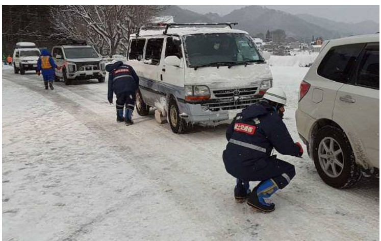
タイヤチェックの状況 (令和4年1月1日 国道17号みなかみ町)