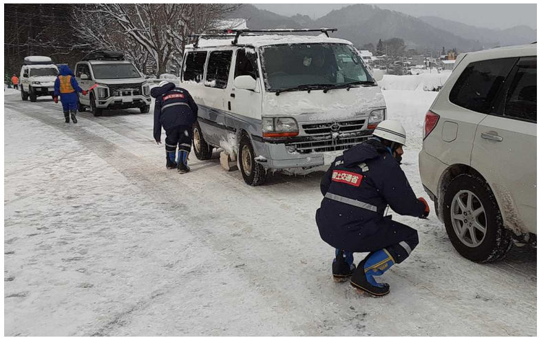
タイヤチェックの状況 (令和4年1月1日 国道17号みなかみ町)