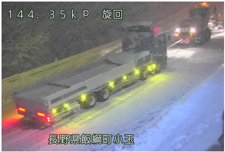
144.35kP 旋回 長野県飯綱町小玉 スタック車両の牽引状況 (令和3年12月17日 国道18号飯綱町)