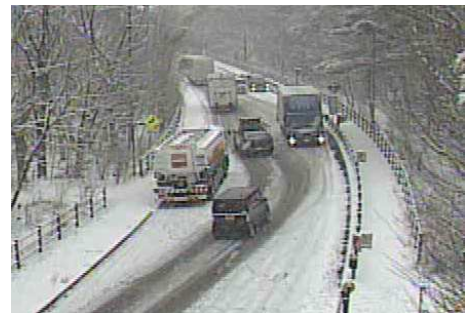
国道139号 籠坂峠【山梨県富士河口湖町】 大型車スタック状況(令和4年1月)