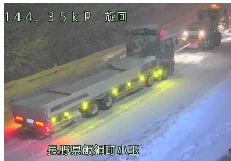
国道18号【長野県飯綱町】 スタック車両の牽引状況(令和3年12月)