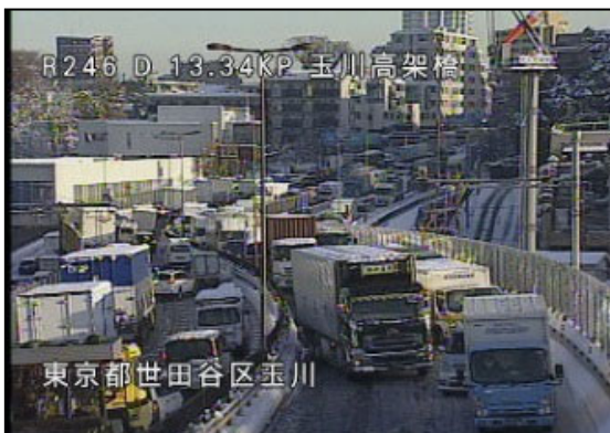
国道246号東京都世田谷区(平成30年1月)

過去の南岸低気圧に伴う関東地方での大雪の際は、スタック車両に伴う滞留が多く発生しています。