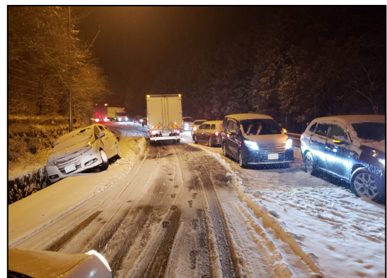
国道1号箱根新道(平成31年3月)