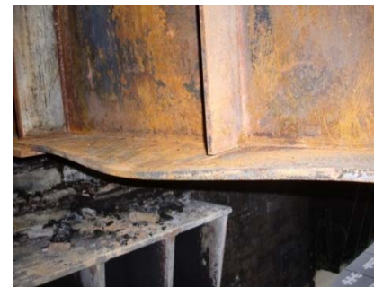
現在の状況（主桁の一部変形状況）