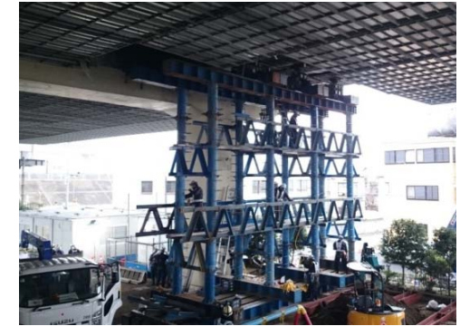
現在の状況（仮設支柱設置状況）