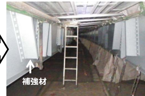
復旧イメージ（※他の現場での事例）