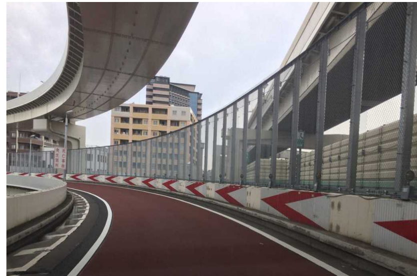
3号狩場線（上）阪東橋出口