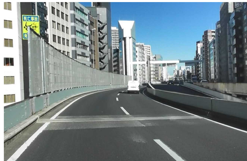
1号上野線（下）本町付近