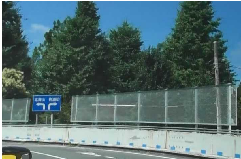
4号新宿線（下）外苑出口