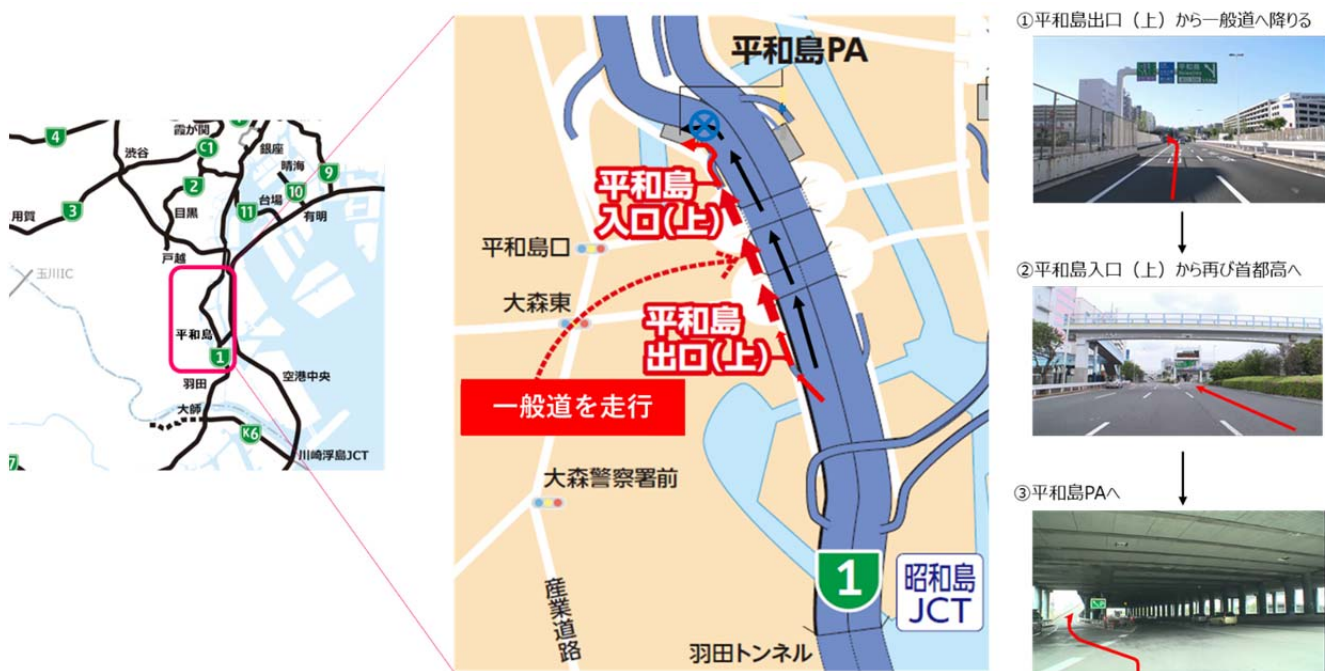
平和島PA利用方法図