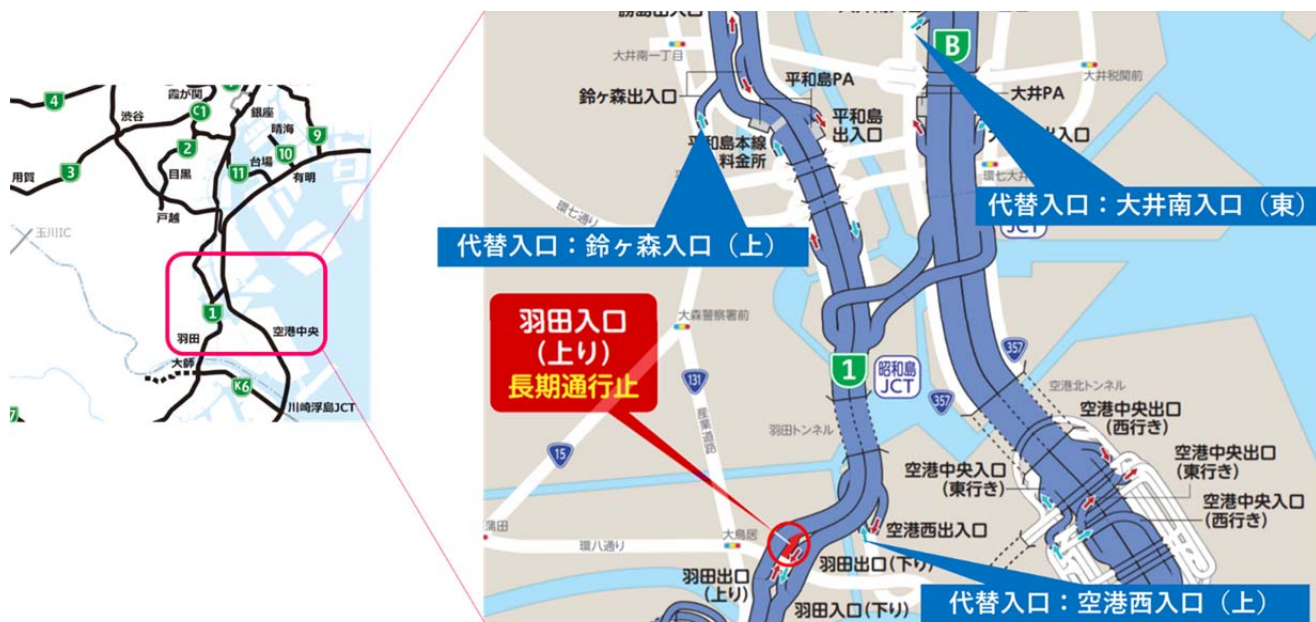
羽田入口（上）長期通行止め概要図