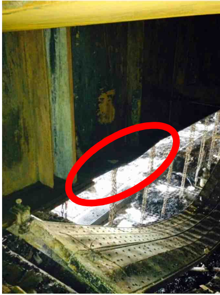
主桁(G2)変形状況（足場内から）