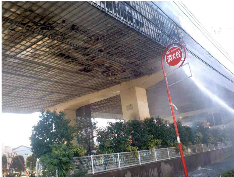
足場焼損状況(高架下から)