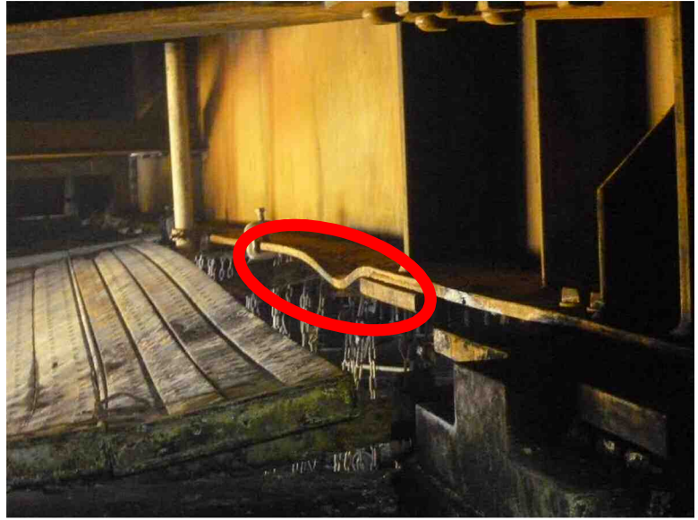
主桁(G3)変形状況（足場内から）