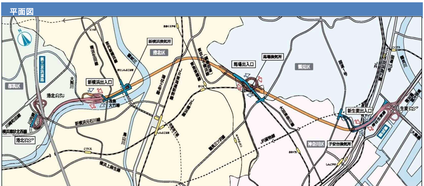
※図表中の出入口、換気所の名称は仮称です。