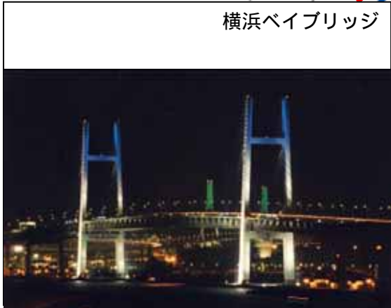
横浜ベイブリッジ