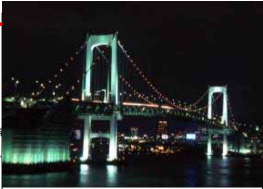
レインボーブリッジ