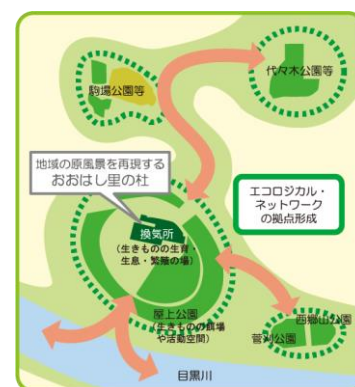
【エコロジカル・ネットワーク】