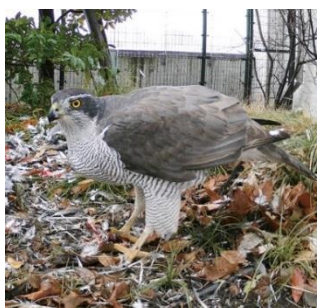
【オオタカ林床利用】

これは、おおはし里の杜が目黒川周辺のエコロジカル・ネットワークの一部としての機能を果たしている結果だと考えられる。