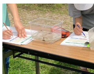
【区教育委員会と連携した講座の開催】