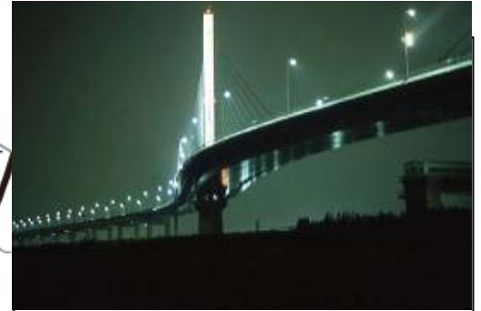
かつしかハープ橋