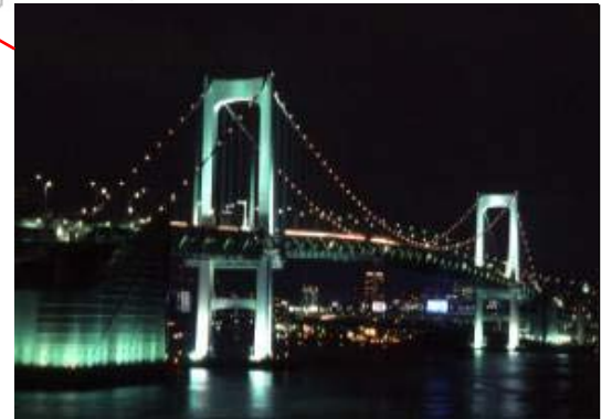
レインボーブリッジ