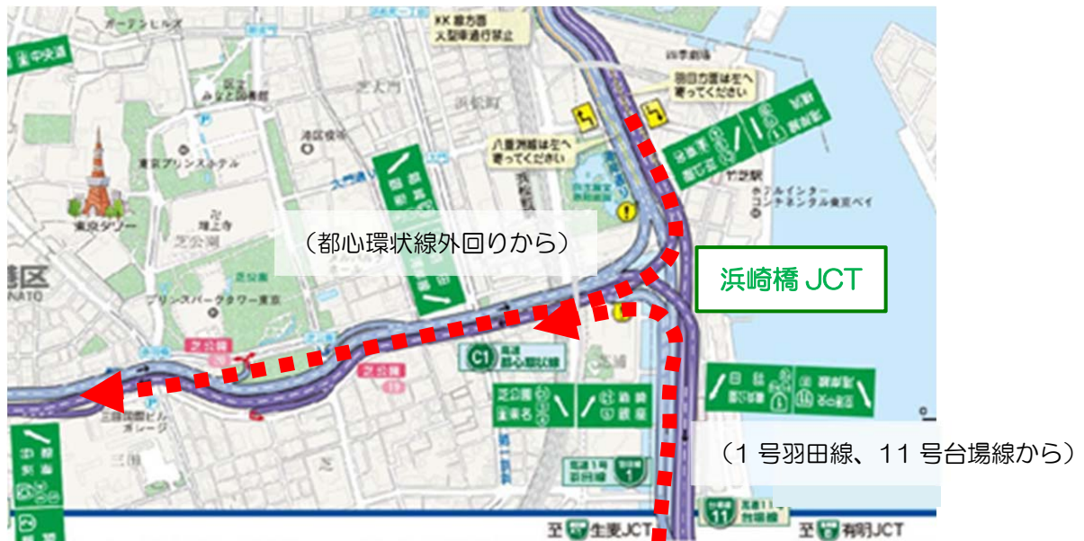
【浜崎橋ジャンクション付近開通前後の混雑時における渋滞状況変化】

これまで1日平均9時間（平成25年度平日実績）発生していた渋滞がほぼ解消しました