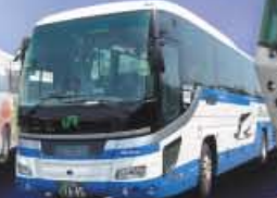
ジェイアールバス関東