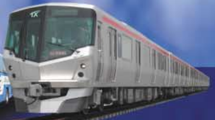
つくばエクスプレス