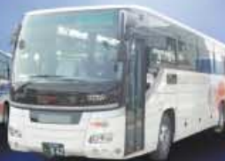
日立電鉄交通サービス