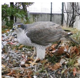
【オオタカ林床利用】

これは、おおはし里の杜が目黒川周辺のエコロジカル・ネットワークの一部としての機能を果たしている結果だと考えられる。