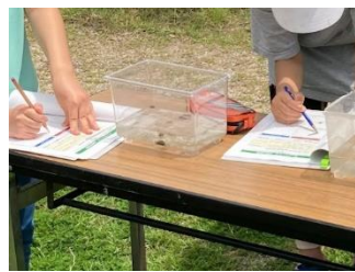
【区教育委員会と連携した講座の開催】