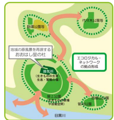
【エコロジカル・ネットワーク】