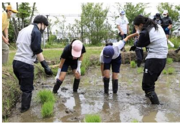
【地域小学生による稲作体験】