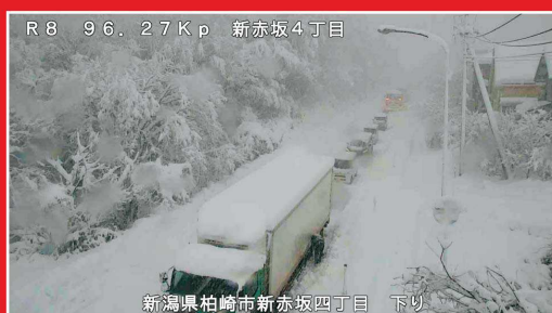
令和4年12月19日 国道8号(登坂不能車による交通障害の発生状況)